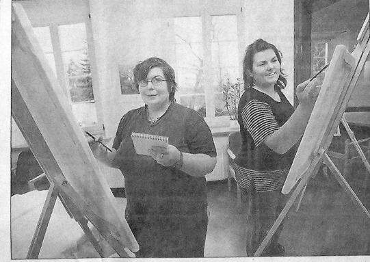
An einer Staffelei können die wenigsten Künstler zu Hause arbeiten. Im „Haus Dahmshöhe“ genießen sie die kreativen Möglichkeiten und die Atmosphäre.

Dahmshöhe einmal ein Aufeinandertreffen von behinderten und nicht behinderten Künstlern gibt. Gefördert wird der mehrtägige Workshop unter anderem von der „Aktion